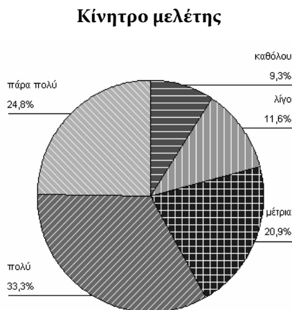
Σχήμα 2. Το ΑΣΕΑ σαν κίνητρο μελέτης.